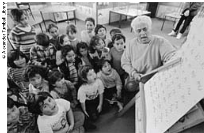
En Nueva Zelanda existen "nidos lingüísticos" donde se transmite la lengua maorí a los más jóvenes..

Personalmente, a la pregunta de por qué debemos preocuparnos por la preservación de las lenguas, yo respondería concisamente así: porque cada idioma es un universo mental estructurado de forma única en su género, con asociaciones, metáforas, modos de pensar, vocabulario, gramática y sistema fonético exclusivos. Todos esos elementos funcionan conjuntamente en el marco de una estructura que, por ser extremadamente frágil, puede desaparecer para siempre con suma facilidad.