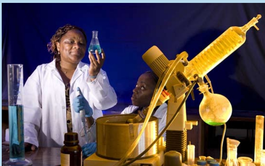
Tello Nyokong (Sudáfrica)

La asociación entre L'ORÉAL y la UNESCO abarca también un programa de becas destinadas a científicas jóvenes que realizan trabajos de investigación posdoctorales, con vistas a permitirles su prosecución en laboratorios situados fuera de sus países de origen. El programa L'OREAL-UNESCO "La Mujer y la Ciencia" ha otorgado hasta la fecha 120 becas internacionales y 340 nacionales a mujeres que cursan estudios de doctorado y posdoctorado. Cada una de las becas está dotada con una suma de 40.000 dólares y se concede por una duración de dos años a 15 jóvenes, a razón de tres por cada una de estas cinco partes del mundo: África y Estados Árabes; Asia y el Pacífico; América del Norte y Europa; y América Latina.