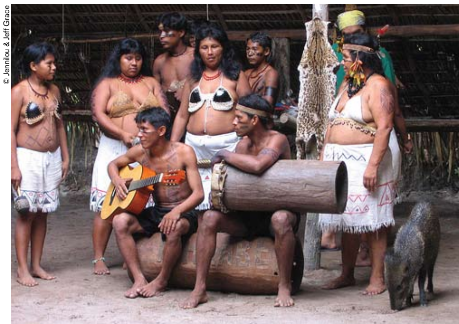
Amazonia (Brasil): varias lenguas indígenas están desapareciendo. Hasta mediados del siglo XVII, el tuli, por ejemplo, estaba tan extendido como el portugués.

Paralelamente, los redactores encargados de las diferentes partes y yo, personalmente, hemos supervisado la preparación de los textos. La totalidad del proyecto se ha podido llevar a cabo en un lapso de tiempo muy apretado: un año tan sólo desde su inicio hasta su culminación