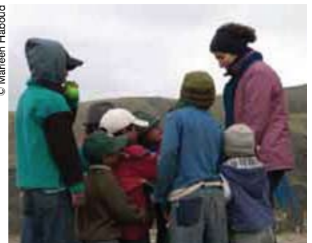
La transmisión de una lengua a los más pequeños es fundamental para su supervivencia.