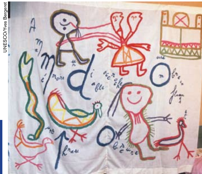
Según la tradición, la cobra es guardiana de la lengua toro tegu, que se habla en el territorio dogón (Mali).

La piedra es palabra mineralizada, el agua es palabra reidora, el grano plantado es palabra promesa: la lengua toro tegu, hablada en la actualidad por cinco mil dogón en el norte de Mali, concibe cada elemento de lo real como su parte integrante.