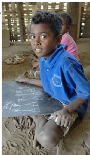
En Papua Nueva Guinea se hablan más de 800 lenguas. Los niños pueden iniciar su escolaridad en su lengua materna.