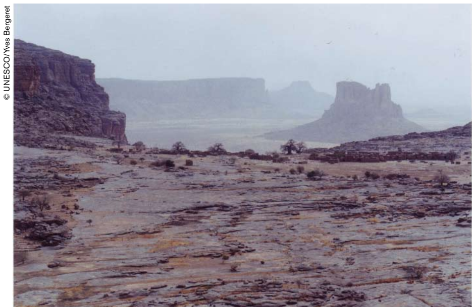
Para los habitantes de Koyo, la cima de la montaña encarna la palabra en toda su fuerza. El poder de la palabra se debilita a medida que se baja la pendiente.