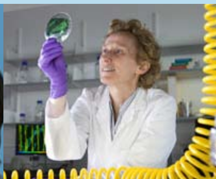
Athene M. Donald (Reino Unido)