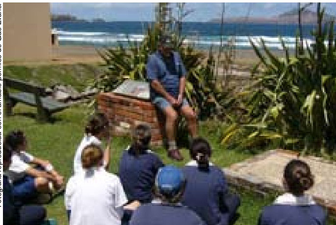
Curso de lengua norfolk junto a una placa conmemorativa de la primera vez que se estableció una colonia, en 1788.