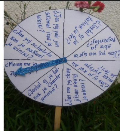
“ La ruleta”, recurso material