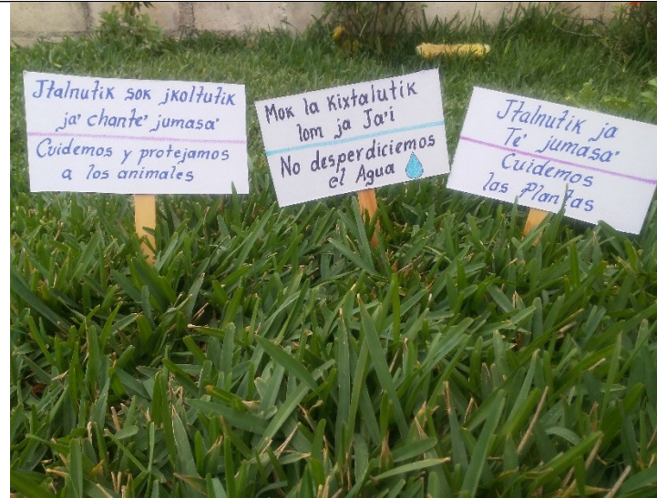
Ejemplos de letreros para el cuidado del medio ambiente

Yaj ch'akta b'ob'uk ja ( Letrero ) jumasa', ja je'uman sok ja neb'uman ju'uni' oj wa sts'ap ekan b'a wa sk'ana skoltajel ja lu'umk'inali'.